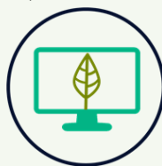
Ecología computacional aplicada/o modelación