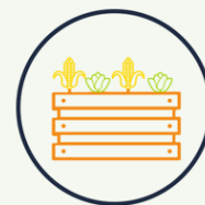
Agroecología y sistemas productivos