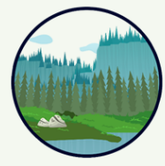
Ecología del paisaje y usos del suelo