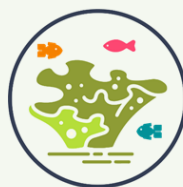
Recurso hídrico, ecosistemas marinos y continentales