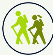
Generación de conocimiento y divulgación científica