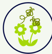
Ecología funcional y servicios ecosistémicos