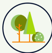
Restauración Ecológica y especies invasoras