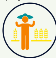
Sistemas socioecológicos y conflictos socio-ambientales