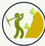
Impacto ambiental y políticas ambientales